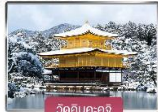
วัดคินคะคุจิ