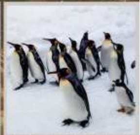
"PENGUIN ASAHIYAMA ZOO"