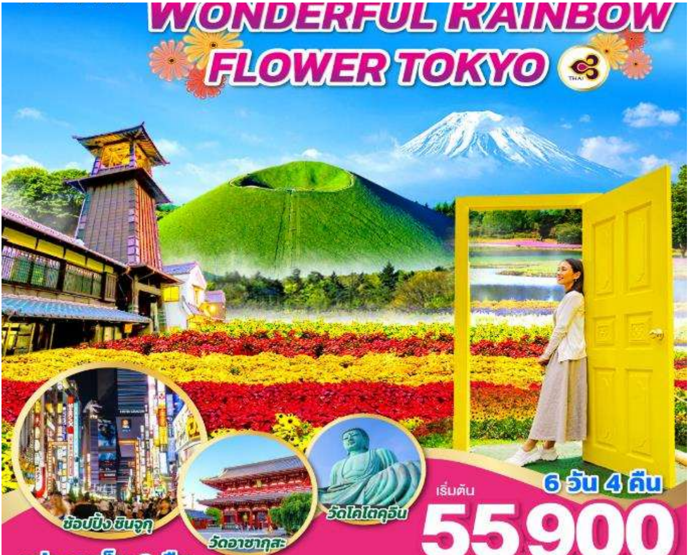
ช้อปปิ้ง ชิinjuku