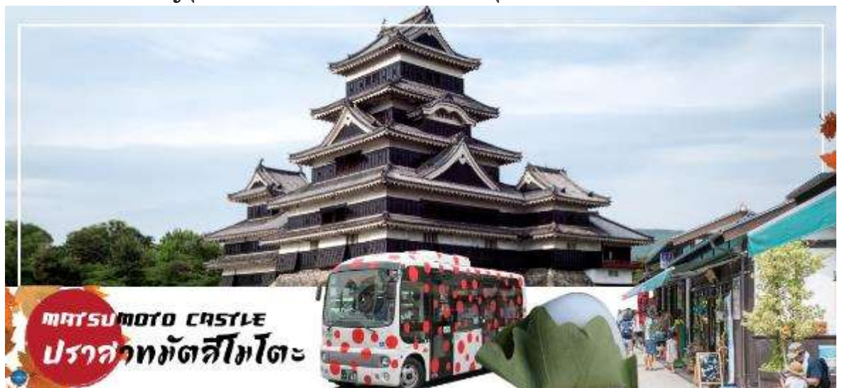
MATSUMOTO CASTLE ปราสาทมัตสึโมโตะ

นำท่านชม ปราสาทมัตสึโมโตะ (Matsumoto Castle) (ด้านนอก) เป็น 1 ใน 12 ปราสาทดั้งเดิมที่ยังคงสภาพสมบูรณ์และสวยงามที่สุดของประเทศญี่ปุ่น และเป็น 1 ใน 5 ปราสาทที่ได้รับการขึ้นทะเบียนเป็นสมบัติประจำชาติ เป็นปราสาทที่สร้างอยู่บนพื้นที่ราบ มีเอกลักษณ์ตรงที่มีหอคอยและป้อมปืนเชื่อมต่อกับโครงสร้างอาคารหลัก และเนื่องจากผนังปราสาทมีสีดำและปีกด้านต่างๆ ของปราสาทแผ่กางออกเหมือนปีกนก เลยมีชื่อเรียกว่า คาราซุโจ ที่แปลว่า ปราสาทอึกา สำหรับข้างในตัวปราสาทมีชั้นบันไดสูงชันและเพดานที่ไม่สูงมาก บริเวณทางเดินจัดแสดงวัสดุเครื่องใช้ทางประวัติศาสตร์ เช่น ชุดเกราะซามูไรสมัยเซ็นโกกุ, ปืนคาบศิลาและอาวุธที่เคยใช้สู้รบในสมัยก่อนหน้าต่างเป็นหน้าตาต่างไม่แคบๆ มีช่องสำหรับยิงปืนและยิงลูกธนู ท่านสามารถเพลิดเพลินกับทัศนียภาพของเทือกเขาแอลป์ญี่ปุ่นและเมืองมัตสึโมโตะได้จากชั้นบนสุดของปราสาทแห่งนี้