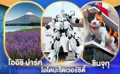
ไออิชิ ปาร์ค ไอโคมะโตเวอร์ซิตี ชินจุกุ

อิสระท่องเที่ยวตามอัธยาศัย หรือเลือกซื้อทัวร์เสริมโตเกียวดิสนีย์แลนด์ แวะจุดชมวิวไออิชิปาร์ค ฟุจิซึบะ ซากุระ ชมทุ่งดอกพืชมอส พิพิธภัณฑ์แผ่นดินไหว DUTY FREE ไอโคมะโตเวอร์ซิตี ซุปป์ิงชินจุกุ