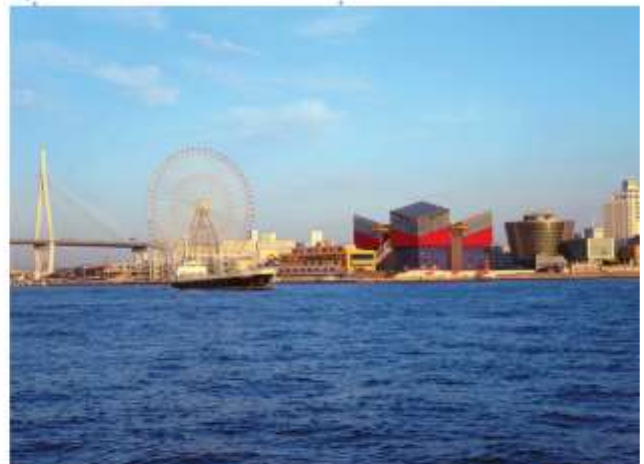
VISIT TEMPOZAN MARKET PLACE