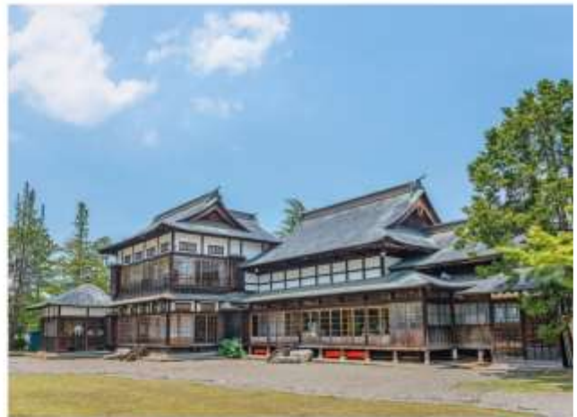
VISIT YUESUGI SHRINE