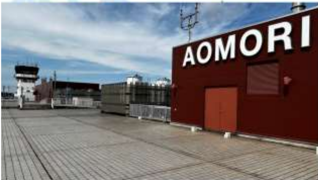
TRNF TO AOMORI AIRPORT/FLY TO ITAMI AIRPORT

เดินทางสู่ "สนามบินอาโอโมริ" ออกเดินทางสู่ "สนามบินอิตามิ" โดยสายการบินเจแปนแอร์ไลน์ เที่ยวบินที่ JL 2154 (13.55 น.-15.35 น.)