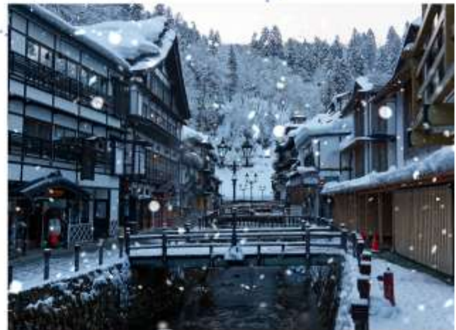
VISIT GINZAN ONSEN