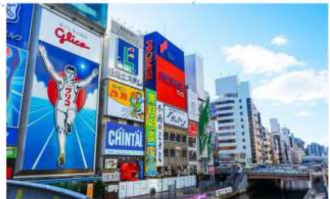
SHOPPING AT SHINSAIBASHI

"โรงงานชิติกะโช" ชมมินิจู รสนม ของฝากสุดคลาสสิกจากโอซาก้า มีขนมหวานมากกว่า 100 ชนิด รวมถึงขนมและเค้กญี่ปุ่น ท่านสามารถเพลิดเพลินกับการช้อปปิ้งขนมหวานได้ตามใจชอบ