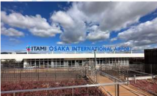
TRNF TO ITAMI AIRPORT/FLY TO YAMAGATA AIRPORT

เดินทางสู่ "สนามบินอิตามิ" ออกเดินทางสู่ "สนามบินยามางาตะ" โดยสายการบินเจแปนแอร์ไลน์ เที่ยวบินที่ JL 2237 (15.50 น.-17.00 น.)