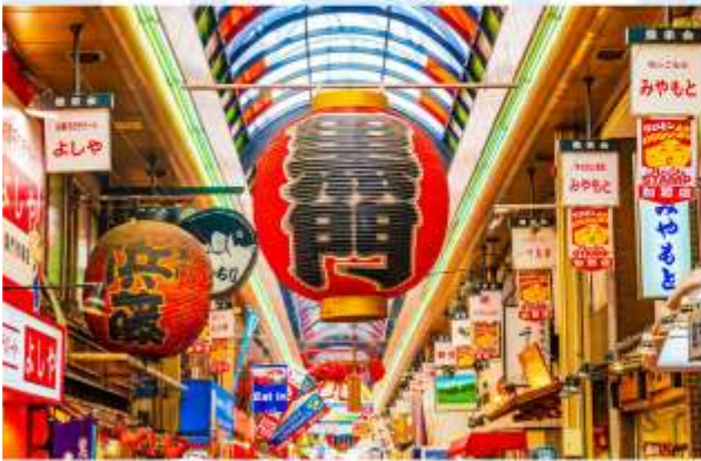
VISIT KURUMON FISH MARKET