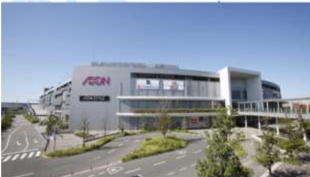
SHOPPING AT AEON MALL RINKU SENNAN/TSUKIGESHO FACTORY

"อีออนมอลล์ ริงกุ เซนบัน" เป็นห้างสรรพสินค้าขนาดใหญ่ ตั้งอยู่ใกล้สนามบีนคันไซ เหมาะสำหรันักท่องเที่ยวที่ต้องการหาของฝาก หรือช้อปปิ้งสินค้าแบรนด์ดังต่างๆ ที่มีร้านค้าให้เลือกมากกว่า 170 ร้าน รวมถึงซูเปอร์มาร์เก็ตขนาดใหญ่ที่มีสินค้าให้เลือกหลากหลาย