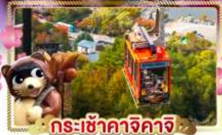
กระเช้าคางิจิกายิ