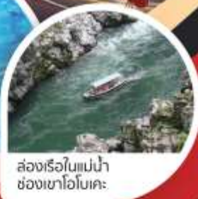
ล่องเรือใบแม่น้ำช่องเขาโอโตะ

นารุโตะ • โคโตะ • โดโกะ • อะฮิเมะ • โอซาก้า