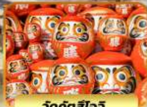
วัดคังสึโอจิ