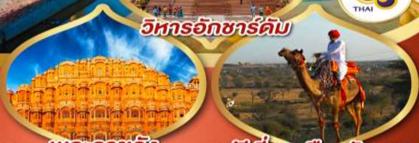
วิหารอักชาร์ดัม