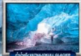
ถ้ำน้ำแข็ง VATNAJOKULL GLACIER

บินตรง สายการบิน Full Service | พิเศษ! ทานอาหารโดนตรง-จกตัว 360 องศา