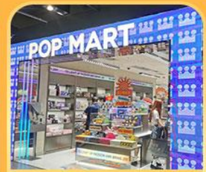
ช้อปปิ้ง POP MART