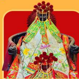
เจ้าแม่กวนอิมสองห้า