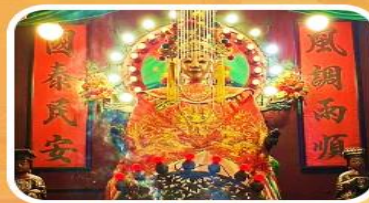
วัดเจ้าแม่กวนอิมเทียนหัว