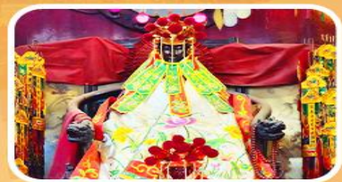
วัดเจ้าแม่กวนอิมสองอ่า