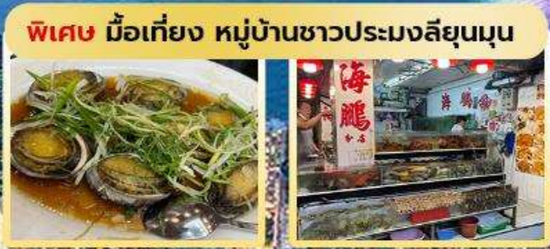
พิเศษ มือเที่ยง หมู่บ้านชาวประมงลิยูนมุน