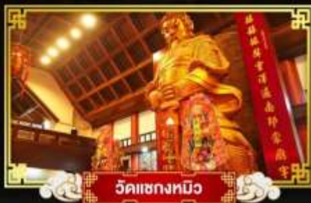
วัดแซงทิว