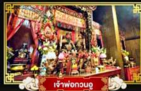
เจ้าพ่อกวนอู