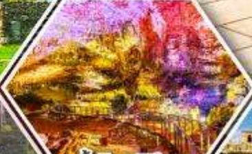
ด้าไฟรมีริอุส