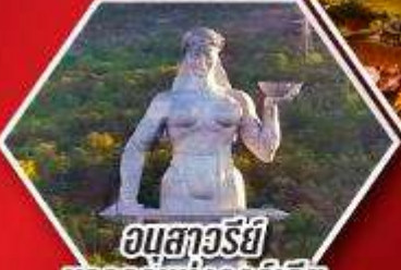
อนุสาวรีย์ มารดาแห่งจอร์เจีย