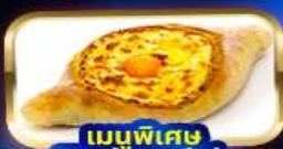
เมนูพิเศษ พิชซ่าจอร์เจีย Khachapuri

гарันті 15 ท่านออกเดินทาง พร้อมหัวหน้าทัวร์คนไทย