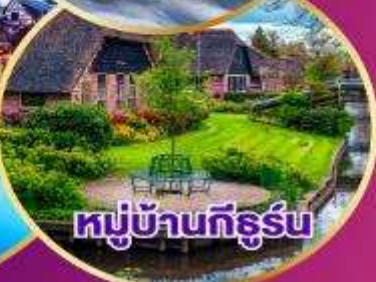
หมู่บ้านทีร์รู่น