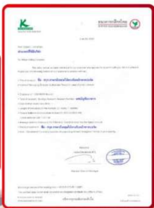
ตัวอย่าง Bank Guarantee ที่ผู้สมัครยื่นขอเงินธนาคาร