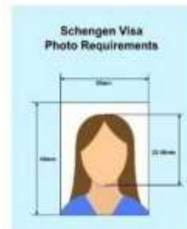
ตัวอย่างรูปถ่าย