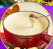
ฟองดูซีส