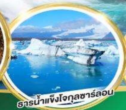
ธารน้ำแข็งโจกุลชาร์ลอน