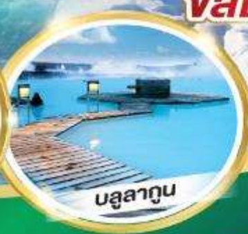
บรูสาทูน