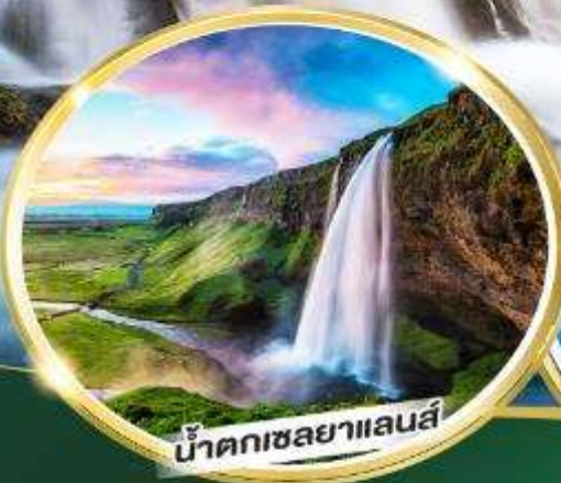
น้ำตกเซลยาแลนส์