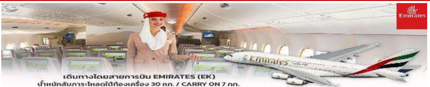
เดินทางโดยสารการบิน EMIRATES (EK) น้ำหนักสัมภาระ-โหลดใต้ท้องเครื่อง 30 กก. / CARRY ON 7 กก.

** การันตี 15 ท่านออกเดินทาง พร้อมหัวหน้าทัวร์คนไทย **