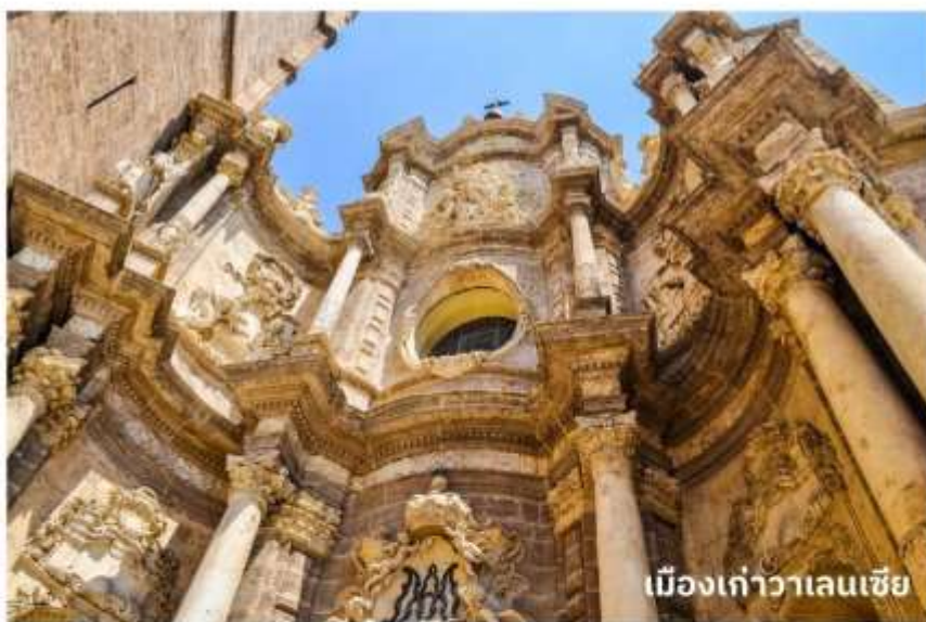
เมืองเก่าวาเลนเซีย