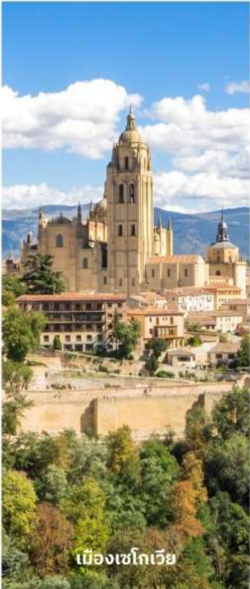
เมืองเซโกเวีย

นำท่านถ่ายรูปกับ มหาวิหารแห่งเมืองเซโกเวีย และ สะพานส่งน้ำโรมัน ที่มีชื่อเสียงนำชมเขตเมืองเก่าซึ่งล้อมรอบด้วยกำแพงที่สร้างขึ้นตั้งแต่คริสต์ศตวรรษที่ 8 และได้รับการบูรณะในระหว่างคริสต์ศตวรรษที่ 15