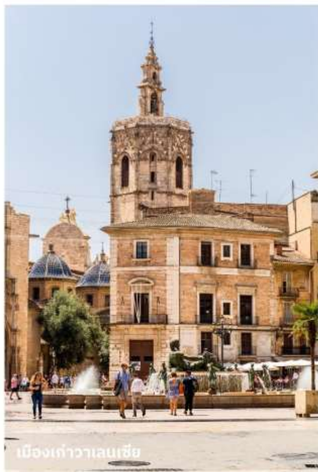
เมืองเก่าวาเลนเซีย