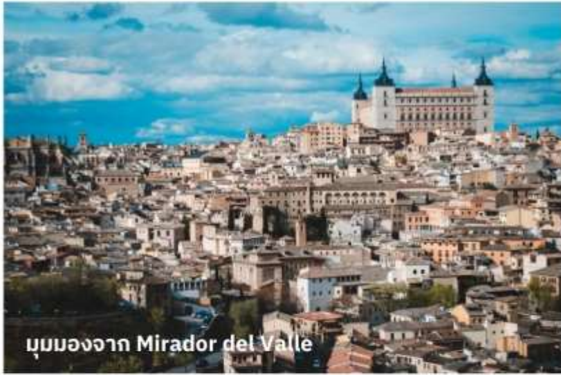
มุมมองจาก Mirador del Valle

จากนั้นเดินทางสู่ เมืองโทเลโด (Toledo) ใช้เวลาเดินทางประมาณ 1 ชั่วโมง อดีตเมืองหลวงเก่าของสเปนตั้งแต่คริสต์ศตวรรษที่ 13 เป็นเมืองแห่งศูนย์กลางประวัติศาสตร์และวัฒนธรรมของสเปน ตั้งอยู่ในแคว้นกัสติยา-ลามันชา ประเทศสเปน โดดเด่นด้วยความหลากหลายทางวัฒนธรรมที่ผสมผสานระหว่างคริสต์ ยิว และมุสลิมจนได้รับการขึ้นทะเบียนเป็นมรดกโลกโดยยูเนสโกในปี 1986