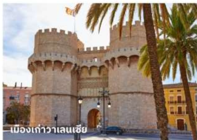
เมืองเก่าวาเลนเซีย

จากนั้นนำท่านเที่ยวชม ย่านใจกลางจัตุรัสเมืองเก่า ซึ่งเป็นที่ตั้งของศาลากลาง, ที่ทำการไปรษณีย์, ร้านค้า, สนามสู่วัวกระทิง นำท่านถ่ายรูปกับ มหาวิหารวาเลนเซีย หรือ มหาวิหารซานตามาเรียแห่งวาเลนเซีย (Catedral de Santa Maria de Valencia) มหาวิหารที่ตั้งอยู่บริเวณใจกลางเมืองเก่า สร้างขึ้นในสไตล์ผสมผสานอาทิ โกรธิค, นีโอคลาสสิก, บาร็อก