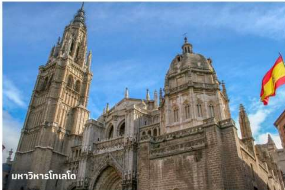
มหาวิหารโทเลโด

จากนั้นนำท่านเดินทางเข้าสู่ ย่านเขตเมืองเก่าโทเลโด นำท่านถ่ายรูปด้านหน้า มหาวิหารโทเลโด (Toledo Cathedral) เป็นมหาวิหารโกธิกที่งดงามที่สุดแห่งหนึ่งในยุโรป และนำท่านถ่ายรูปที่ อัลกาซาร์แห่งโทเลโด (Alcázar of Toledo) ปราสาทที่ตั้งอยู่บนยอดเขาในเมือง เป็นสัญลักษณ์สำคัญของโทเลโด ปัจจุบันเป็นพิพิธภัณฑ์กองทัพ จากนั้นอิสระให้ท่านได้เดินเล่นภายในตัวเมืองเพื่อเลือกซื้อสินค้าที่ระลึกตามอัธยาศัย