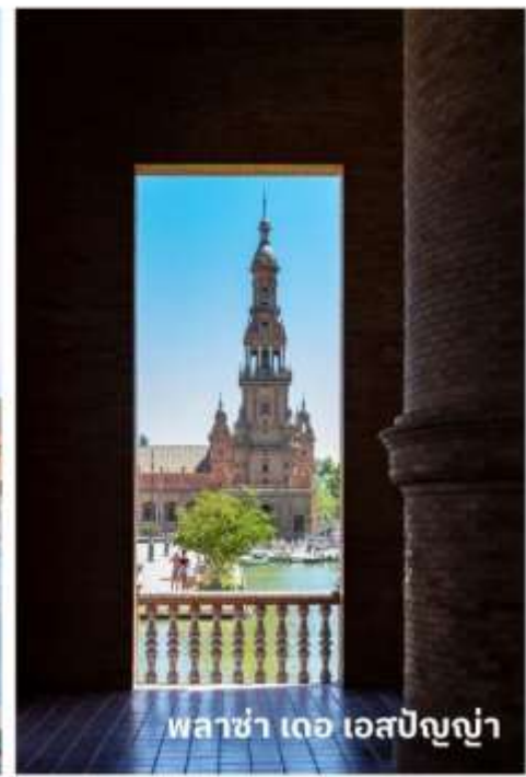
พระราชวัง อัลฮามบรา

ถึงเวลาอันสมควรนำท่านเดินต่อไปยัง เมืองกรานาดา (Granada) ใช้เวลาเดินทางประมาณ 4 ชั่วโมง เป็นเมืองมรดกโลกในแคว้นอัลดาลูเซีย ที่มีเรื่องราวมากมายผสมผสานวัฒนธรรมระหว่างศาสนาคริสต์และอิสลามเมื่อกว่า 1,000 ปีก่อนหน้านี้ แต่ยังคงทิ้งซึ่งความงดงามและมนต์ขลังไว้อย่างสมบูรณ์