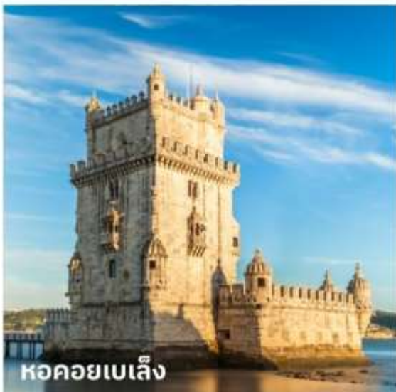
หอคอยเบเล็ง