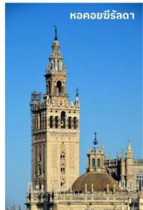
หอคอยฆีรัลดา

หลังจากนั้นนำท่านเดินทางสู่ เมืองคอร์โดบา (Cordoba) ใช้เวลาเดินทางประมาณ 2 ชั่วโมง ครั้งหนึ่งเคยถูกครอบครองโดยชาวโรมันและชาวมัวร์จากอาหรับ เมืองคอร์โดบาตั้งอยู่ริมฝั่งแม่น้ำกัวดาลกีเบีย เป็นเมืองศูนย์กลางของวัฒนธรรมมุสลิมในประเทศสเปน องค์การยูเนสโกได้ประกาศให้เมืองคอร์โดบาเป็นเมืองมรดกโลกของประเทศสเปน เมืองนี้เป็นเมืองในระบบกาหลิบที่มีความเจริญรุ่งเรืองที่สุดของยุโรปในสมัยศตวรรษที่ 10 มีการสร้างมหาวิทยาลัยเน้นการเรียนรู้ด้านวรรณกรรม, วิทยาศาสตร์ ปรัชญาและการแพทย์