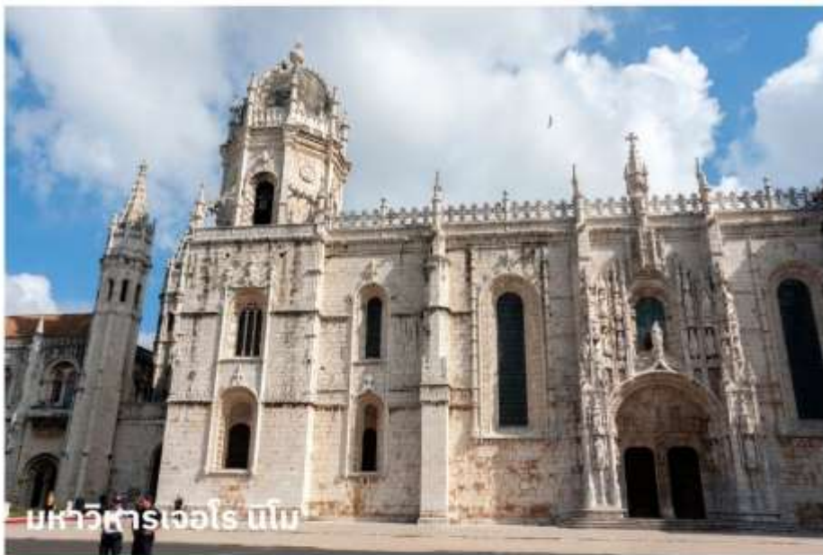
มหาวิหารเจโรนิโม

จากนั้นนำท่านบันทึกภาพกับ อนุสาวรีย์ดีสคัฟเวอรี สร้างขึ้นในปี ค.ศ. 1960 เพื่อฉลองการครบ 500 ปี แห่งการสิ้นพระชนม์ของ เจ้าชายเฮนรี่ เดอะเนวิเกเตอร์