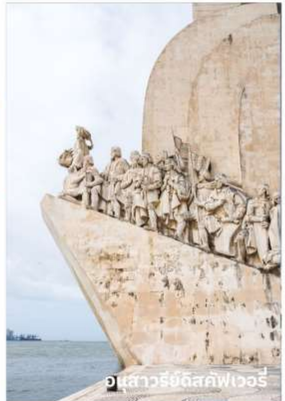
อนุสาวรีย์ดีสคัฟเวอรี