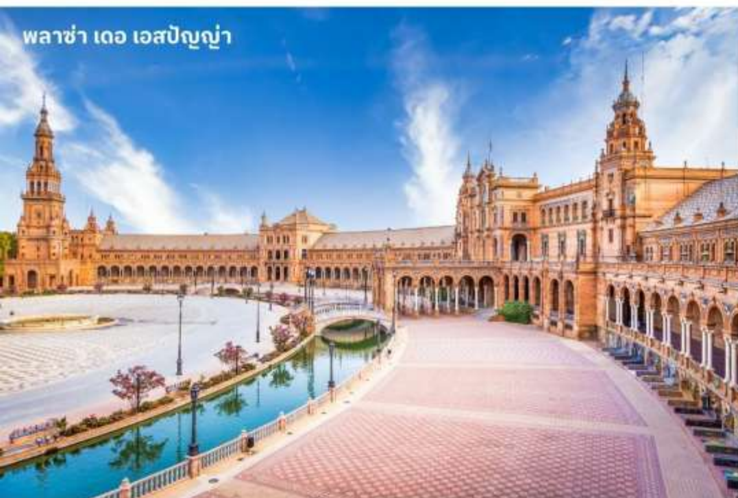
พลาซ่า เดอ เอสปันญา

จากนั้นนำท่าน เข้าชมด้านในมหาวิหารแห่งเซวิลญา (seville cathedral) วิหารแห่งเมืองเซวิลญา มีขนาดใหญ่เป็นอันดับ 3 รองจากมหาวิหารเซนต์ปีเตอร์ที่กรุงโรม และเซนต์ปอลที่ลอนดอน และใหญ่ที่สุดในสเปนสร้างด้วยศิลปะแบบโกธิค ภายในตกแต่งได้อย่างงามวิจิตร สร้างขึ้นแทนที่ตั้งของสุเหร่าเดิม โดยต้องการให้ยิ่งใหญ่แบบไม่มีใครเทียบเทียมได้ ในห้องเก็บทรัพย์สมบัติล้ำค่า มีทั้งภาพเขียน, เครื่องใช้ในพิธีของศาสนาที่ทำมาจากทองคำและเงินล้วนแต่ประเมินค่ามิได้ อีกทั้งยังเป็นที่เก็บศพของโคลัมบัสอีกด้วย จากนั้นนำท่าน เข้าชมหอคอยฆีรัลดา (giralda) ตึกทรงรูปสี่เหลี่ยมผืนผ้าสูง 93 เมตร ติดกันกับมหาวิหาร เป็นลานส้มและน้ำพุเพื่อใช้ในพิธีชำระร่างกายของอิสลามด้านหน้าเป็นลานกว้างมีปราสาทอัลคาซาร สถาปัตยกรรมที่ยังคงมีคราบเงาความบรรเจิดและความคิดสร้างสรรค์ของชาวมัวร์ในอดีตเคยเป็นพระราชวังของกษัตริย์สเปนมาก่อน