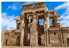
วิหารคอมมอโบ