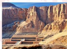
วิหารฮัคเซฟซุต

** พักที่ JAZ Crown Jewel Nile Cruise 4* หรือเทียบเท่า **