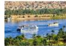
พักผ่อนตามอัธยาศัยบนเรือสำราญ

** พักที่ Royal Beau Rivage Nile cruise 5* หรือเทียบเท่า **