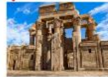
วิหารคอมมอมโบ