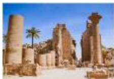
มหาวิหารคาร์นัค

xx.xx น. ออกเดินทางสู่เมืองลักซอร์ เที่ยวบิน... xx.xx น. เดินทางถึงสนามบินลักซอร์