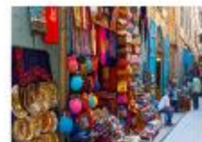
ตลาดข่านเอลคาลิลี

20.50 น. ออกเดินทางสู่อิสตันบูล เที่ยวบิน TK695