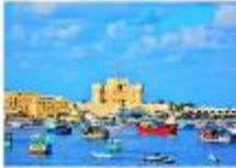
เมืองอเล็กซานเดรีย

** พักที่ Mamlouk Pyramids Hotel 4* หรือเทียบเท่า **