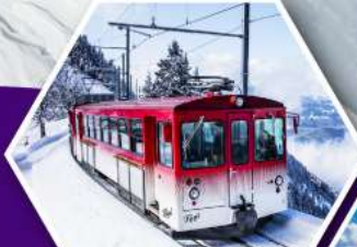
นั่งรถไฟไต่เขาริกิ