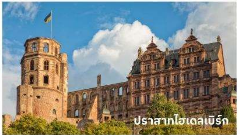
ปราสาทไฮเดลเบิร์ก

จากนั้นนำท่าน เข้าชมปราสาทไฮเดลเบิร์ก ตั้งอยู่บนเนินเขาโดยรอบมีป่าละเมาะแสนสวยให้นักท่องเที่ยวสามารถเดินเล่นได้ บริเวณปาร์กของปราสาทจะมีต้นไม้ใหญ่อย่างต้นเบิช ต้นเมเปิ้ล ต้นโอ๊ค เมื่อขึ้นไปอยู่บนเนินเขาที่ตั้งของปราสาทจะมีจุดชมวิวที่จะมองลงไปดูตัวเมืองเก่าไฮเดลเบิร์ก และยังเห็นแม่น้ำเนคคาร์ ที่ไหลผ่าน ตัวเมืองไฮเดลเบิร์กอีกด้วย