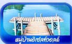
หมู่บ้านอิเซลทอว์คัลด์