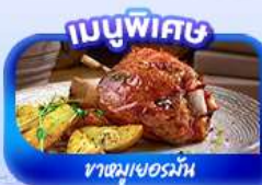
ชาวมูเซอร์มัน

มิวนิค ปราสาทนอยชวาสไตน์ ลูเซิร์น ชุก ซูริก GLACIER 3000