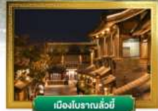
เมืองโบราณลั่วอี้