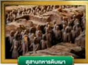
สุสานทหารดินเผา