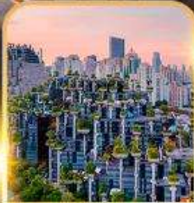
Tian An 1000 Trees