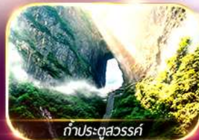
ท่าประตูลั่วจื่อ