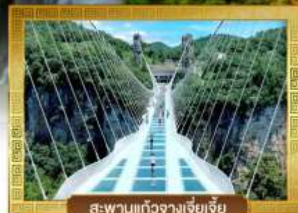
สะพานแก้วจางเจียเจีย