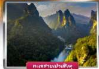
ทะเลสาบเก้าเหลี่ยม