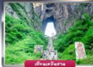
ถ้ำมังกรผืนผ้า