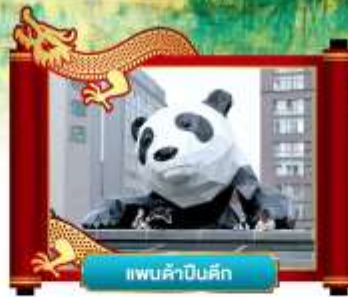
แพนดำเซลฟี