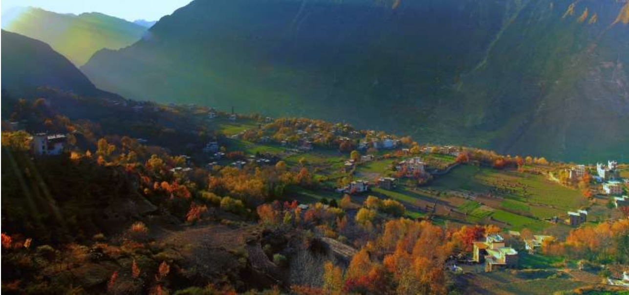
Photo shows the picturesque autumn scenery of Danba county, southwest China's Sichuan Province.

นำท่านนั่งรถของอุทยาน เข้าสู่ ซวงเฉียวโกว หรือ หุบเขาสะพานคู่ มีระยะทาง 34.8 กม. มีพื้นที่รวม 216 ตารางกิโลเมตร จุดท่องเที่ยวแบ่งออกเป็น 3 ส่วน ส่วนแรก หุบเขาหิ้นหยาง ทุ่งต้นหยาง แล้วเดินทางเข้าสู่ส่วน ลึกสุดท่านจะได้เห็นธารน้ำแข็ง ภูเขากระจกแก้ว ภูเขาดวงอาทิตย์ ภูเขาดวงจันทร์ ยอดเขากระต่าย ส่วนกลาง นำท่านย้อนกลับมาชมทะเลสาบ ส่วนที่สาม นำท่านชมทุ่งหญ้าเหนียนหยูป่า ชมยอดเขารูปร่างแปลกตา เช่น ยอดเขาพราน ยอดวังโปตาลา ยอดเขาเพชร ภูเขาหญิงตั้งครรภ์ ถ่ายรูปกันอย่างจุใจกับท้องทุ่งกว้างที่มีฉากหลัง เป็นภูเขาสูงปกคลุมด้วยหิมะขาว ในหุบเขาจะมีลำธารใสสะอาด และสนสูงสีเขียวเข้มสลับด้วยต้นไม้หลายหลาก เฉดสี เช่น เขียวอ่อน เขียวแก่ เหลืองส้ม แดง น้ำตาลเข้ม เนื่องจากอยู่ในฤดูกาลใบไม้เปลี่ยนสี