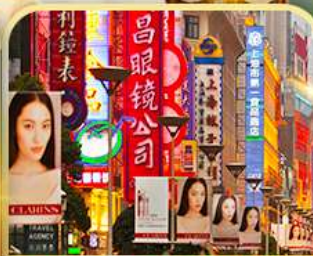
เดินเล่นถนนหนานจิง