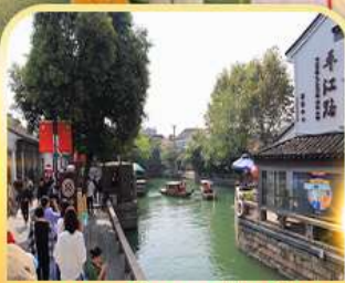
ท่องเที่ยวโบราณผิงเจียง