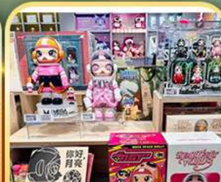
Popmart หังโจววัน 77