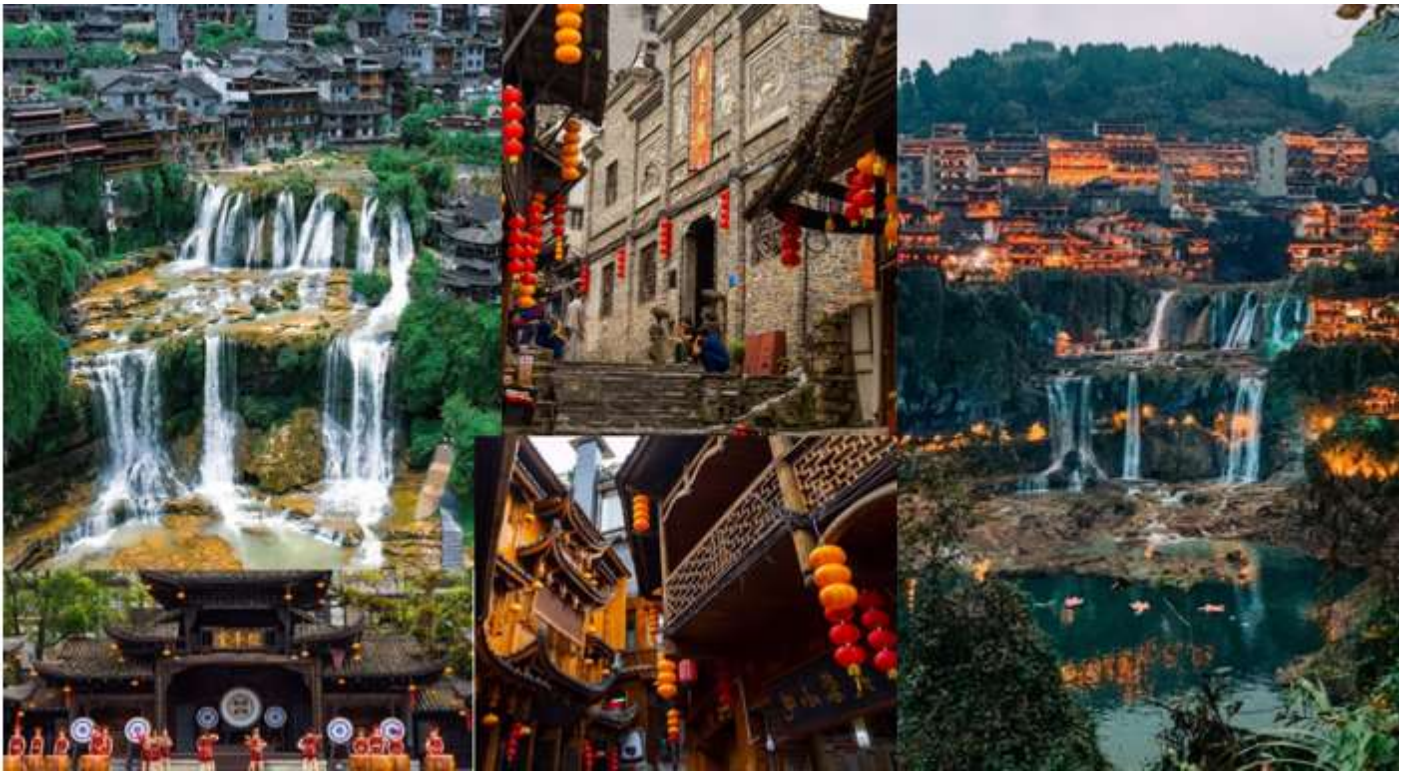
กลางวัน รับประทานอาหารกลางวัน ณ ภัตตาคาร (เมื่อที่ 9)