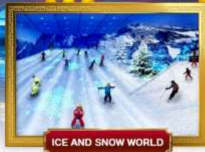
ICE AND SNOW WORLD