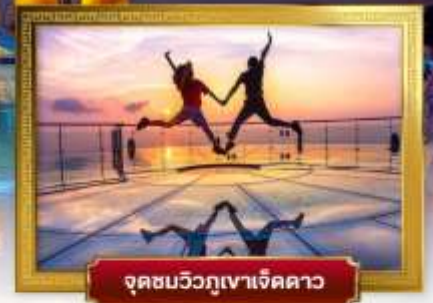
จุดชมวิวกูเขาเจ็ดดาว