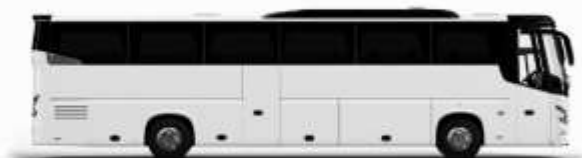
ตัวรถปรับอากาศ 1 ชั้น

ค่าที่พักตามที่ระบุในรายการหรือเทียบเท่าระดับเดียวกับ (ห้องพักละ 2 ท่าน) หากประเภทห้องพักท่านริเวคลาเดียม อาทิ เช่น ริเวคลาห้องพักเป็น TWIN BED หรือ DOUBLE BED ทางบริษัทขอสงวนสิทธิ์ในการปรับประเภทห้องพัก เป็น ตามที่โรงแรมมีอยู่ โดยไม่ต้องแจ้งให้ทราบล่วงหน้า