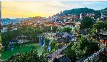
เมืองโบราณฟูหรงเจิน