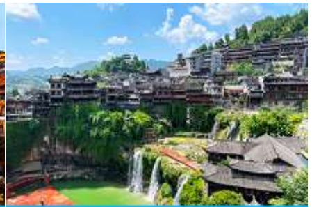
เมืองโบราณฝูหรงเจิ้น