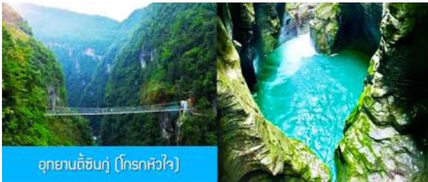
อุทยานตี้ซินกู่ (โกรกหัวใจ)

พักที่ โรงแรม ENSHI XIPU HOTEL ระดับ 4 ดาวท้องถิ่นหรือเทียบเท่าในเมืองเอินซือ