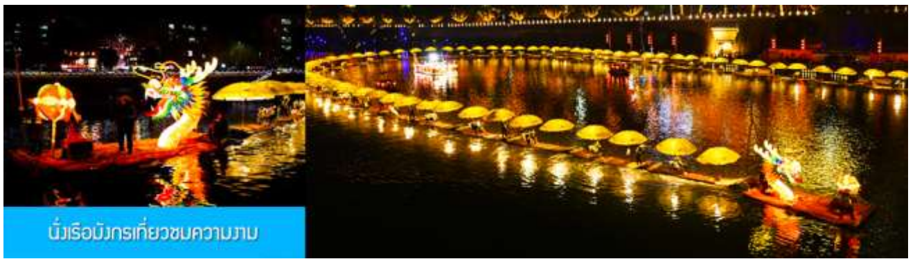
มังกรเรือมังกรเที่ยวชมความงาม

หลังอาหารนำท่านเดินทางเข้าที่พัก หรือท่านสามารถเลือกซื้อ โปรแกรมเสริม เป็นตัวนั่งเรือมังกรเที่ยวชมความงามของ บ้านเรือนและสิ่งปลูกสร้างสองฝั่งแม่น้ำในช่วงที่สวยงามที่สุดของเมือง เซียนเอิน ที่ประดับประดาด้วยแสงสี และได้ชื่อว่าเป็นวิวยามค่ำคืนที่สวยงามที่สุดในมณฑลหูเป่ย์ เช่นเดียวกับเมือง โบราณฟงหวงในมณฑลหูหนาน.....อัตราค่าบริการสำหรับ โปรแกรมเสริมนั่งเรือมังกรชมวิวยามค่ำคืน ท่านละ 190 หยวน หรือ 950 บาท ระยะเวลาที่ใช้ในการเรือมังกร ประมาณ 45 นาที ค่าบริการรวม ค่าบัตรเข้าชม ค่ารถรับ ส่ง และค่าน้ำดื่มของไกด์ท้องถิ่น