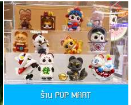
ร้าน POP MART

วันที่ห้า เมืองเอินซือ – อุทยานตี้ซินกู่ (โกรกหัวใจ) – เมืองหยีซัง – ช้อปปิ้งย่าน CBD – POP MART