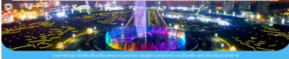
รายการทัวร์อาจเปลี่ยนแปลงได้ตามความเหมาะสม โดยดูสถานการณ์ประจำวันเป็นหลัก แจ้งเที่ยวชมทุกช่องทาง