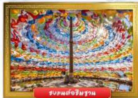
ชมพรจุดรงบนต้อริชฐาน