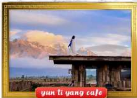
yun ti yang cafe