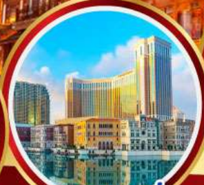
เดอะเวเนเชียน