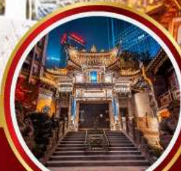
วัดหลัวอัน