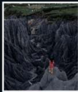
สวนหินปาเหมย์