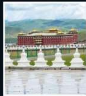
วัดต้ากง