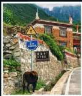
หมู่บ้านทิเบต