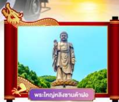
พระใหญ่หลังซานต้าผอ