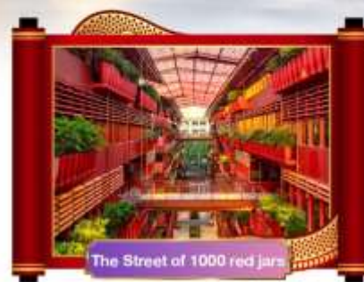
The Street of 1000 red jars

เดินทางโดยสายการบิน ไซน่าอีสเทิร์นแอร์ไลน์