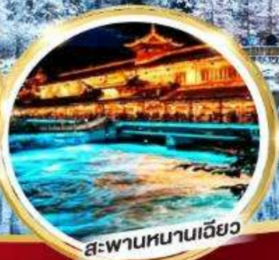
สะพานหนานเฉียว