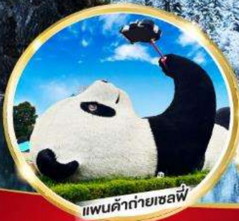
แพนด้ายักษ์เซลฟี่